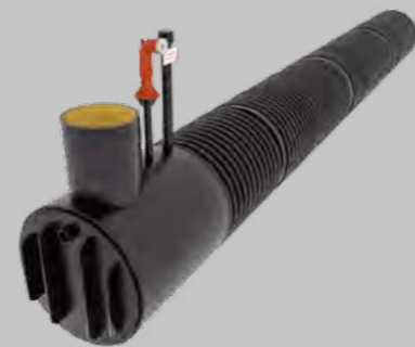
2-teilig meist für 100 - 200 m 3