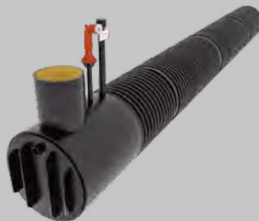
2-teilig meist für 100 - 200 m 3