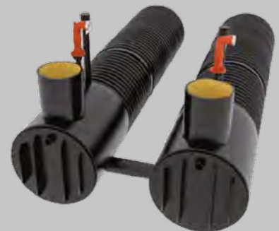
Sonderbauformen für jedes Volumen