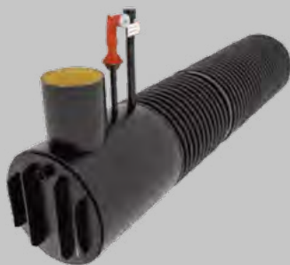
1-teilig meist für 50 - 100 m 3

Andere Ausführungen bzgl. Nennweite und Löschwasservolumen sind natürlich möglich.