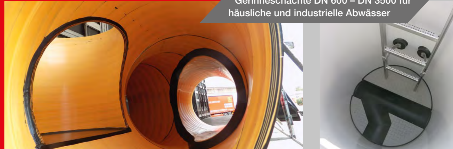
Gerinneschächte DN 600 – DN 3500 für häusliche und industrielle Abwässer