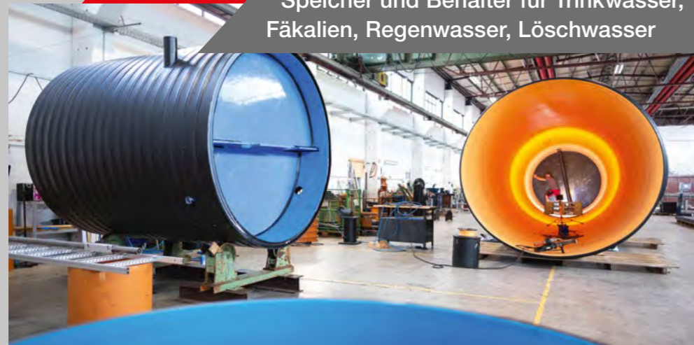
Speicher und Behälter für Trinkwasser, Fäkalien, Regenwasser, Löschwasser