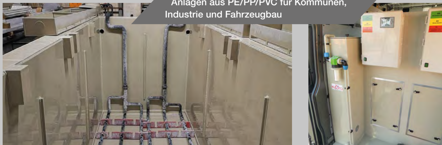
Anlagen aus PE/PP/PVC für Kommunen, Industrie und Fahrzeugbau